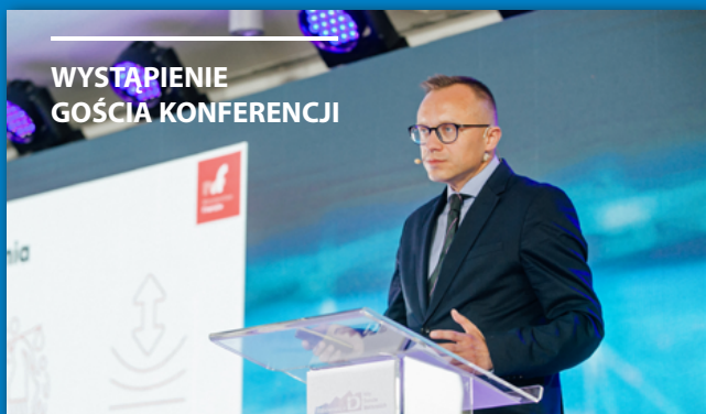
Artur Soboń Wiceminister Finansów